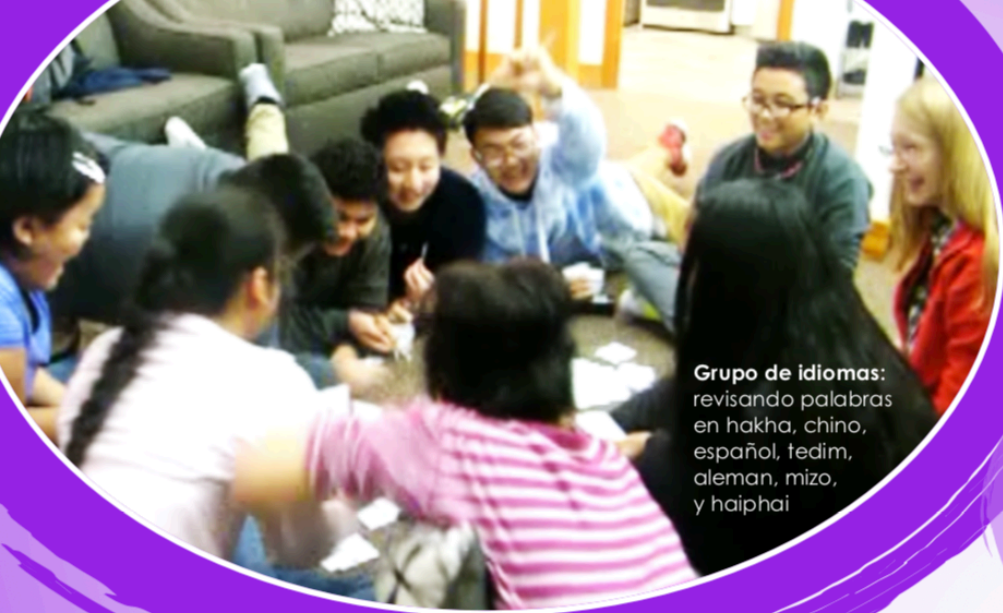
Grupo de idiomas: revisando palabras en hakha, chino, español, tedim, alemán, mizo, y haiphai